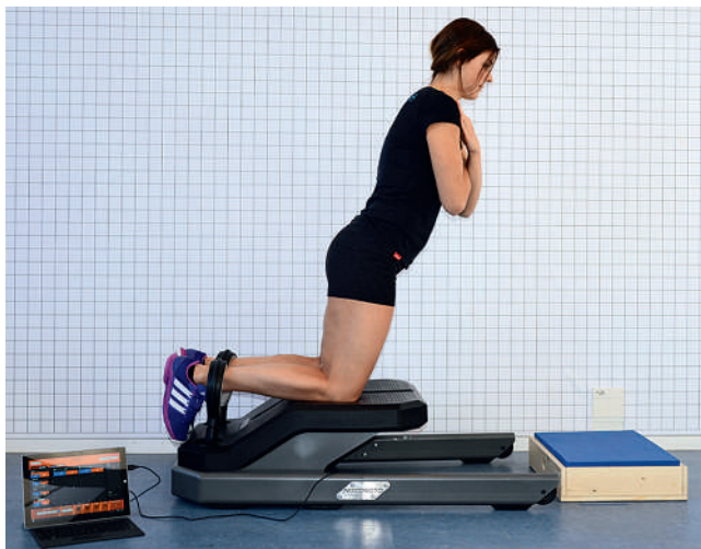
Abb. 1: Testausführung

Die exzentrische Kraft wurde mittels der Übung Nordic-Hamstrings in einer knienden Position auf dem NordBord (Vald Performance, Australien) gemessen (Abb. 1). Dabei sind die Füße fixiert und über die Fixation mit uniaxialen Kraftmesszellen verbunden. Die Datenerhebung erfolgte gleichzeitig auf beiden Seiten in Newton (N). Um die einzelnen Kraftwerte zwischen den Athleten vergleichen zu können, wurden die absoluten Werte zusätzlich in relative Kraftwerte (N/kg) umgerechnet. Folgendes Berechnungsmodell wurde dabei angewendet (A. Shield, persönliches Gespräch, 30. September 2016): (Exzentrische Kraft der ischiocruralen Muskulatur in N x Unterschenkelhöhe in m): (Körpergewicht in kg x Grösse in kniender Position in m). Als Einheit ergibt sich Nm/kgm, gekürzt N/kg. Dadurch werden die einzelnen Hebelverhältnisse und Körperproportionen untereinander vergleichbar. Die Datenerfassung erfolgte durch die SCOREBOARD® Software (Vald Performance, Australien).